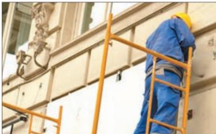
Prevenir los accidentes en el lugar del trabajo, objetivo del Congreso

En el Congreso se abordarán cuestiones relativas a los pilares básicos de la PRL: seguridad, medicina del trabajo, higiene industrial y ergonomía y psicología. Y se podrá escuchar a los expertos en PRL de empresas pioneras en la materia como Telefónica, BP Oil España, Indra, Acciona, Alcatel - Lucent, Bureau Veritas, Fremap o Vodafone España, entre muchas otras empresas y organizaciones. También intervendrán las PYMES.